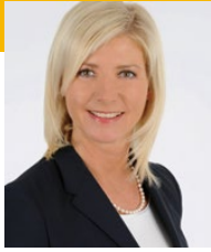
Ulrike Scharf Mdl

Bayerische Staatsministerin für Umwelt und Verbraucherschutz