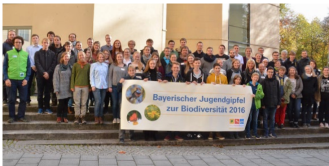
Jugendgipfel 2016

Um eine verbindliche Anmeldung bis 6. November 2017 unter jugendgipfel@pan-gmbh.com wird gebeten.